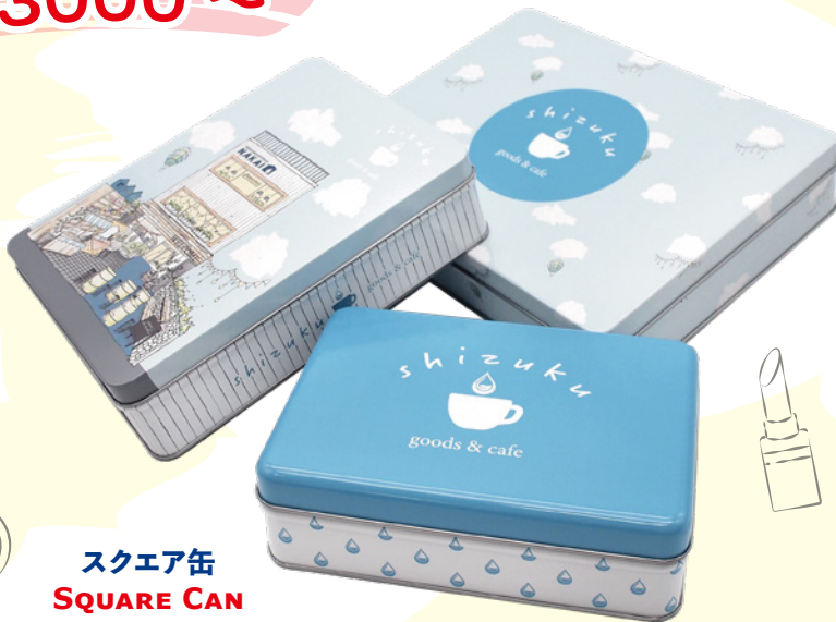
スクエア缶 SQUARE CAN