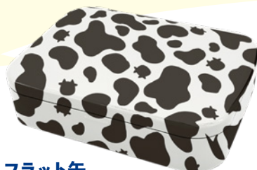
フラット缶 FLAT CAN