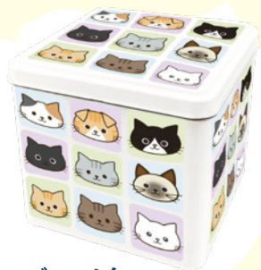
ブロック缶 Block CAN