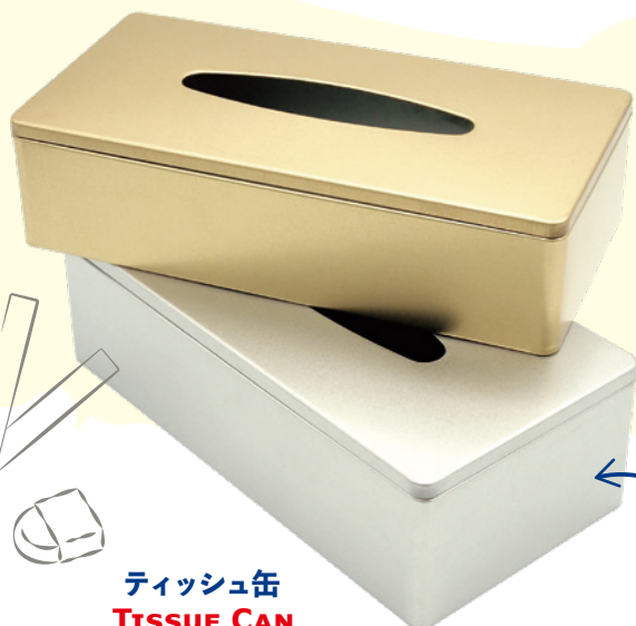
ティッシュ缶 TISSUE CAN