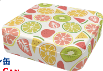
キャレ缶 CARRE CAN