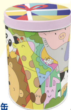
コロ缶 COLONNE CAN