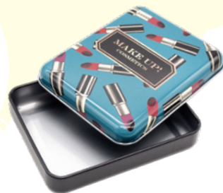
ポケット缶 POCKET CAN