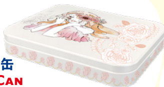
ブリューム缶 BRUME CAN