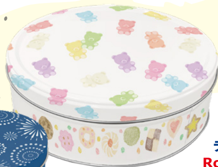
ラウンド缶 ROUND CAN